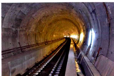
Marmaray, en Turquie.

Avec 6 à 7 % du CA consacrés à la R&D chaque année et forte d'une centaine de personnes en France comme à l'étranger, SDCEM peut faire valoir ses innovations électroniques et offrir à ses clients des compétences inédites. C'est probablement pourquoi l'entreprise vient de décrocher, via sa filiale espagnole, deux importants marchés : Marmaray, en Turquie, premier tunnel sous le Bosphore destiné à désengorger le trafic entre Istanbul-est et Istanbul-ouest ; Haramain, en Arabie Saoudite, pour l'électrification d'une ligne ferroviaire à grande vitesse de 450 km entre Médine et La Mecque. Riche d'une culture basée sur l'amélioration conti-